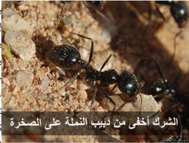
الشرك أخفى من دبيب النملة على الصخرة

والشرك أخفى من دبيب النملة السوداء على الصخرة الصماء في الليلة الظلماء ، وأدناه أن تحب على جور ، وأن تبغض على عدل ، تحب فلاناً وليس كما يريد الله عز وجل ، لقد أشركته مع الله ، وتبغض من نصحك ، ولو كان