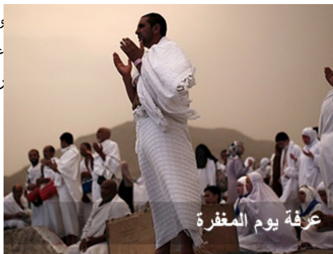
عرفة يوم المغفرة

وروى ابن المبارك عن سفيان الثوري عن الزبير بن علي عن أنس بن مالك رضي الله عنه قال: