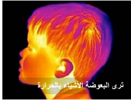
ترى البعوضة الأشياء بالحرارة

هذه المستقبلات تميز بين تطور حراري يقل عن واحد بالألف من درجة الحرارة، وعند صورة كيف أن البعوضة بهذه المستقبلات ترى الأشياء والألوان خاصة بحسب الحرارة