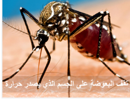
تقف البعوضة على الجسم الذي يصدر حرارة

وترى الشيء الحار بلون آخر، لذلك تتجه إلى جبين الصبي على فراشه دون أن تخطئه بفعل مستقبلات الحرارة التي زودت بها من قبل الله عز وجل