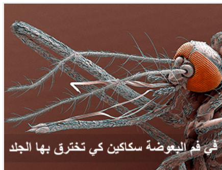
في فم البعوضة سكاكين كي تخترق بها الجلد

أيها الأخوة الأكارم، من منا يصدق أن في خرطوم البعوضة ست سكاكين، أربع سكاكين تقطع جلد الذي تلسعه