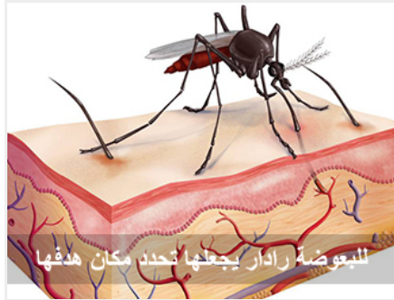
للبعوضة رادار يجعلها تحدد مكان هدفها

لذلك عبروا عن هذه الحقيقة بالرادار، تتجه إلى جبين الصبي.