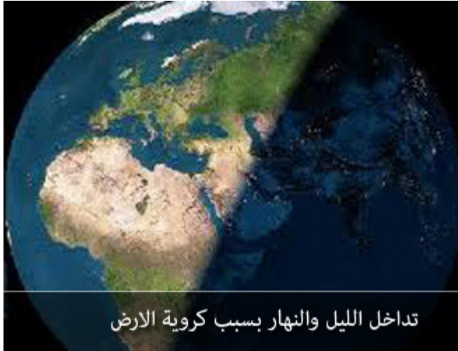
تداخل الليل والنهار بسبب كروية الأرض

هذا دليل كروية الأرض، سمعت ولم أقرأ في الكتاب أن مؤلف الكتاب وهو يقرأ القرآن وصل إلى قوله تعالى وهو يخاطب فرعون بعد أن أغرقه الله: