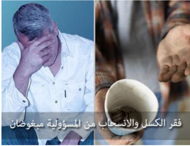
فقر الكسل والانسحاب من المسؤولية مبغوضان

تلاحظ أحياناً إنساناً لا يعمل شيئاً، تسويف، وتأجيل، ومماطلة، وانسحاب من المسؤولية، جالس ينظر إلى الناس . شخص يجلس ساعة أمام بابه، يمر شخص ينظر إليه، والثاني ينظر إليه، لا يعمل شيئاً، إما أن يتابع مسلسلات، أو في غيبة ونميمة، أنت ماذا فعلت؟ ماذا قدمت لهذه الأمة؟ لم يقدم شيئاً، يقول لك: فقير، لا يوجد عمل، صحيح، هذا