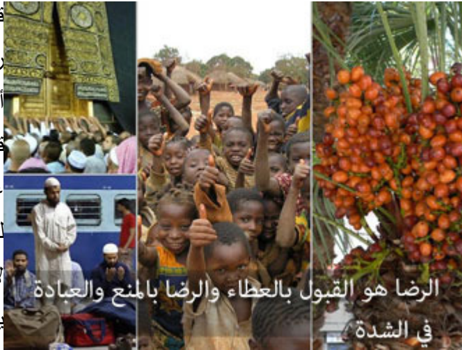
الرضا هو القبول بالعبادة والرضا بالمنع والعبادة في الشدة

قال بعض العلماء: متى يكون الإنسان راضياً عن الله؟ إذا أقام نفسه على أربعة أصول؛ يقول: يا رب إن أعطيتني قبلت، وإن منعتني رضيت، وإن تركتني عبدتك، وإن دعوتني أجبتك، دعاك للصلاة أجبت، دعاك للحج أجبت، دعاك للإنفاق مالك أنفقت، شعرت بوحشة، لا يوجد إقبال، إذا لم تلاحظ إقبال بالصلاة، فالصلاة لا تترك، يوجد شخص إذا لم