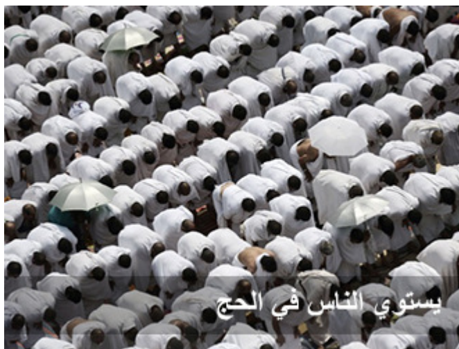
يستوي الناس في الحج

في الحج أمرك الله جل جلاله أن تترك بلدك ، بيتك ، زوجتك ، أولادك ، تجارتك ، وظيفتك ، مدير دائرة مثلاً ، مدير مؤسسة ، مركبتك ، مكانتك ، ثيابك العسكرية أحياناً ، ثيابك المدنية الأنيقة جداً أحياناً ، دع الدنيا وراء ظهرك ، وتعال إلي ، تعال يا عبدي كي تذوق طعم القرب مني ، تعال يا عبدي كي أريحك من هموم جائمة على صدرك ، تعال يا عبدي لترى ما عندي من الرحمة ، كأن الله يدعوك إليه ، من هذا الذي يستحق رحمة الله ؟