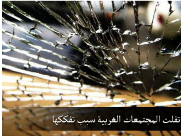
تفلت المجتمعات العربية سبب تفككها

ما يتاح للزوج ليرى من زوجته لا يتاح لأقرب الناس إليها، أبيها، وأخيها، ولا ابنها، ولا أي إنسان آخر يتاح له من امرأة ما يتاح للزوج من زوجته، بل إن بعض العلماء، وهذا رأي الجمهور أن الزواج إن لم يكن على التأييد فهو زنى، لأن الزواج المؤقت فيه غش للمرأة، يمكن أن تطلق لأسباب يقبلها الله منك، لكن