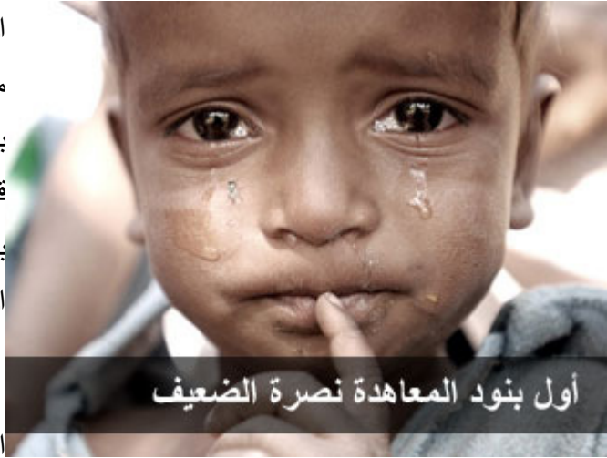
أول بنود المعاهدة نصره الضعيف

مجتمع مخترق، وإذا أخترق المجتمع قوي عليه أعداءه، وما من أمة تريد أن تكون محصنة إلا وتسعى لنصرة الضعيف، والنبي عليه الصلاة والسلام يبين أن أحد أسباب النصر أن نعطي الضعفاء حقهم.