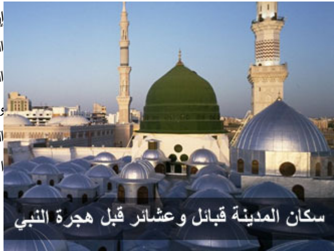
سكان المدينة قبائل وعشائر قبل هجرة النبي

إنّ النبي عليه الصلاة والسلام وجد في المدينة مزيجاً إنسانياً متنوعاً من حيث الدين والعقيدة، وحيث الانتماء القبلي، والعشائري، ومن حيث نمط المعيشة، المهاجرون من قريش، والمسلمون من الأوس والخزرج، والوثنيون من الأوس