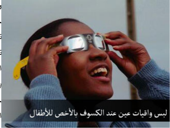
لبس واقيات عين عند الكسوف بالأخص للأطفال

ولكن كسوف الشمس مناسبة مغرية جداً، كي تحدق في قرصها، وحينما تحدق في قرص الشمس يمكن أن تصاب الشبكية بأذى خطير، والأذى الذي قاله الأطباء لا يصحح، ولا يرمم، بل تحترق طبقة من طبقات الشبكية، إذا حدقت في قرص الشمس في أثناء الكسوف تحترق الشبكية، والعلماء قالوا: إذا كان هذا الخطر قائماً على الكبار فهو