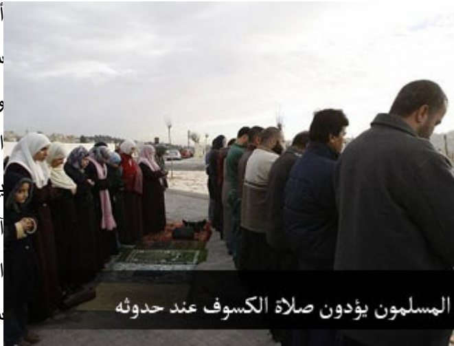
المسلمون يؤدون صلاة الكسوف عند حدوثه

أيها الأخوة الكرام، وعدتكم في درس سابق أن يكون هذا الدرس عن الكسوف وصلاة الكسوف، لأنه بحسب الحسابات الفلكية سوف نشهد كسوفاً في هذا البلد يوم الأربعاء الحادي عشر من شهر آب، بعد الظهر بقليل، ولأن صلاة الكسوف مشروعة في الإسلام، وهي سنة مؤكدة، وعند الأحناف واجبة، فلا بد من الحديث عن الكسوف أولاً، ثم