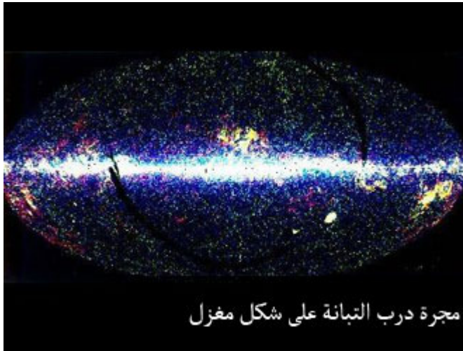
مجرة درب التبانة على شكل مغزل

عن صلاة الكسوف، وكيف تؤدي، وعن شروطها، وما إلى ذلك.