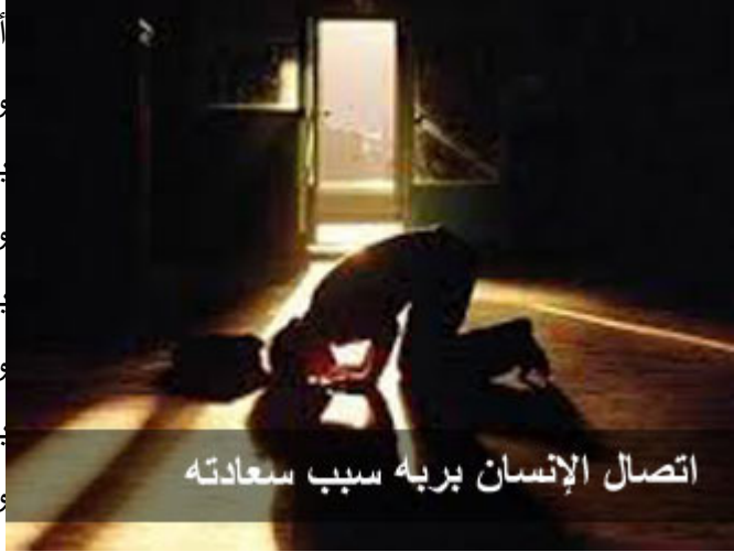
اتصال الإنسان بربه سبب سعادته

أيها الأخوة، السموات، بمجراتها، وكواكباتها، ونجومها، وكواكبها، بيروجها، ومذنباتها، بشموسها، وأقمارها، والأرض، بجبالها، وسهولها، ببحارها، وأنهارها، بأسمائها، وأطيّارها، ونباتاتها، وأزهارها، بحيواناتها، ومخلوقاتنا، بليلها، ونهارها، وشمسها، وقمرها، والإنسان، بخلقه، وطباعه، وبنيته، وأعضائه،