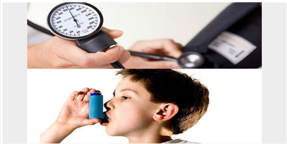
الحبة السوداء تفيد في حالات ارتفاع ضغط الدم وحالات الربو

أيها الأخوة، ولكن ماذا درس العلماء اليوم من أجل أن يتبين أن النبي لا ينطق عن الهوى؟.