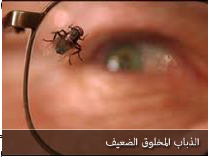
الذبابة المخلوق الضعيف

ضرب الله سبحانه وتعالى للناس مثلاً الذبابة، هذا المخلوق الضعيف المستنذر