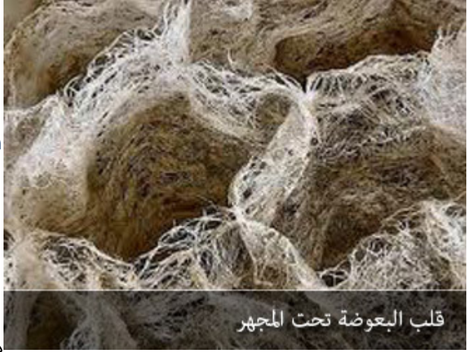
قلب البعوضة تحت المجهر

أرقى عصورهم مع تقدم العلم عاجزين عن أن يخلقوا ذباباً، قال تعالى: