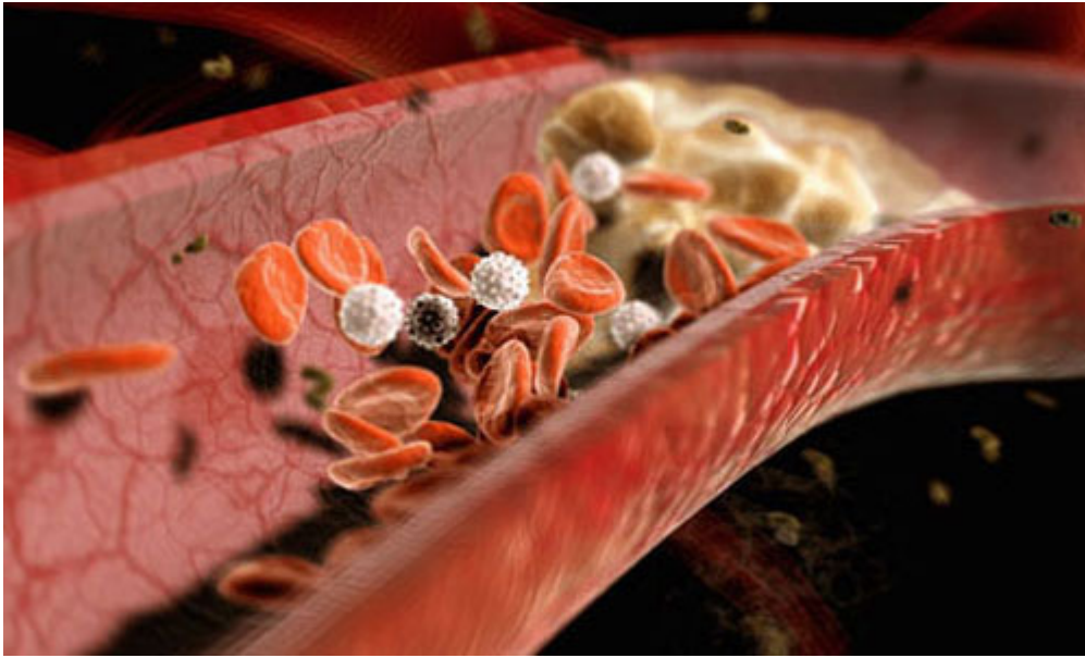
خثرة تغلق أحد الشرايين

شيء آخر، تكون نسبة الأشعة فوق البنفسجية أكبر عند الشروق، منها حين ترتفع الشمس في كبد السماء، وهذه الأشعة فوق البنفسجية، هي التي تحرض الجلد على صنع الفيتامين ( د )، والفيتامين ( د ) هو وحده الذي يثبت الكلس في العظام، فبسبب هشاشة العظام ، وسرعة كسر العظام، وضعف البنية العظمية، النوم إلى بعد طلوع الشمس .