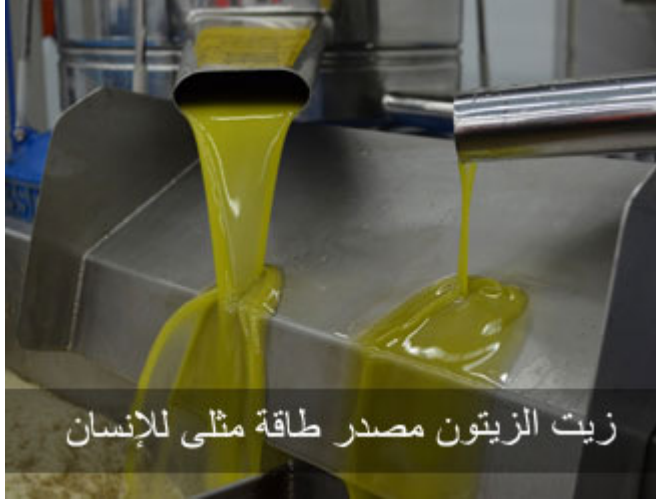
زيت الزيتون مصدر طاقة مثلي للإنسان

أكدت البحوث العلمية الصحيحة التي ظهرت قبل سنوات؛ أن زيت هذه الشجرة وقودٌ للإنسان، بكلِّ ما تعنيه هذه الكلمة من معنى، ففي كلِّ غرام من زيت الزيتون، ثمان وحدات حرارية، تعدُّ طاقةً مثلى للإنسان. قال علماء التغذية: الحوامض الدهنية نوعان؛ مشبعة وغير مشبعة، فالمادة الدسمة المشبعة تبقى عالقةً في الدم،