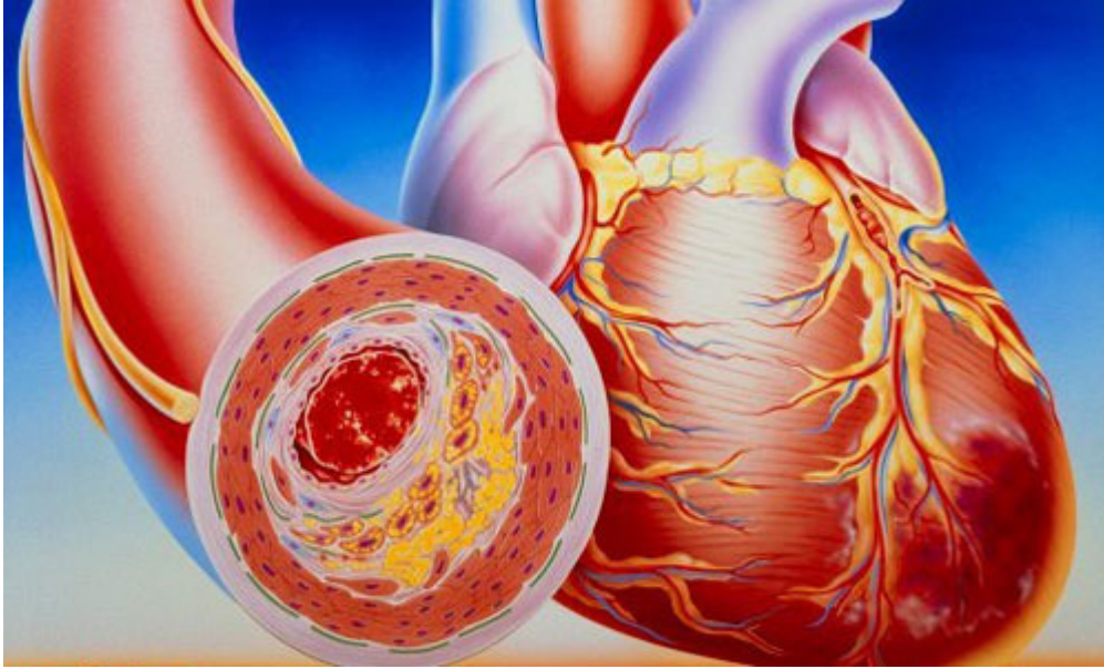
المواد الدهنية المشبعة ضارة بالإنسان فهي تضيق الأوعية وتصلبها

وربما تراكمت على جدران الشرايين، فسببت تضيقها، وسببت تصلبها، وسببت ضعف القلب، فالمواد الدهنية المشبعة ضارةٌ بالإنسان، أما المواد الدهنية غير المشبعة فهي تتوازن حينما تلتهم بقية الأنواع الدهنية، وصف العلماء زيت الزيتون بأنه حوامض دهنية غير مشبعة تفيد الجسم، وتمنع الترسبات الدهنية في جدران الشرايين الدموية، بعكس الحوامض الدهنية المشبعة الموجودة في أكثر الزيوت الحيوانية.