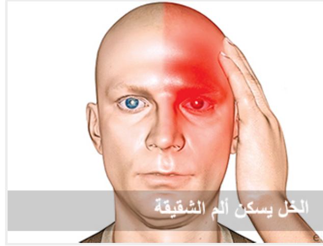
الخل يسكن ألم الشقيقة

و يشفي التهاب المفاصل، ويزيل الترسبات داخل شرايين الجسم