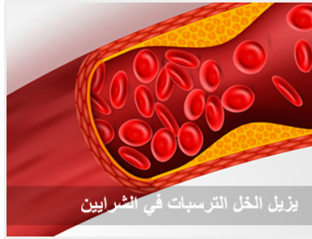
يزيل الخل الترسبات في الشرايين

و يشفي التهاب المفاصل، ويزيل الترسبات داخل شرايين الجسم