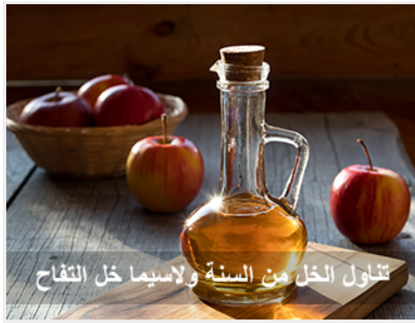
تناول الخل من السنة ولاسيما خل التفاح

فهذا كلام النبي ليس من عنده، إن هو إلا وحي يوحى، إنه طبيب القلوب، وطبيب الأجساد، وهذا من الطب النبوي