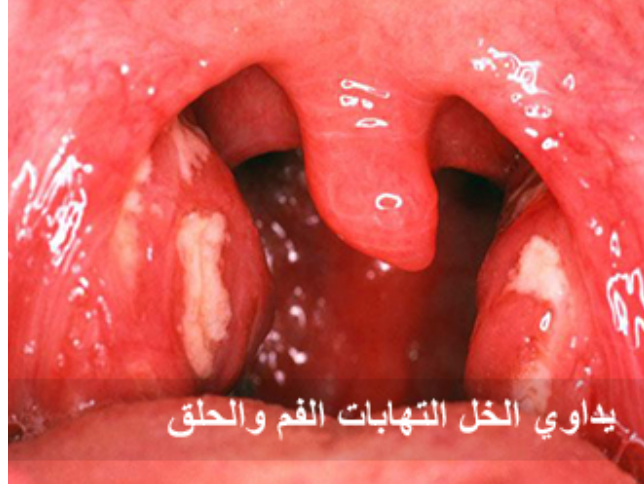
يداوي الخل التهابات الفم والحلق