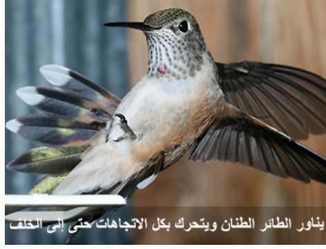
يتأور الطائر الطنان ويتحرك بكل الاتجاهات حتى إلى الخلف

يستطيع بتغيير زاوية جناحيه أن يتقدم للأعلى والأسفل، والأمام والخلف، رفرقة الطنان بجناحيه وعدم تضارره منها أبداً محيراً جداً، لا يستطيع أي إنسان أن يحرك ساعديه في الثانية إلا مرة واحدة على الأكثر