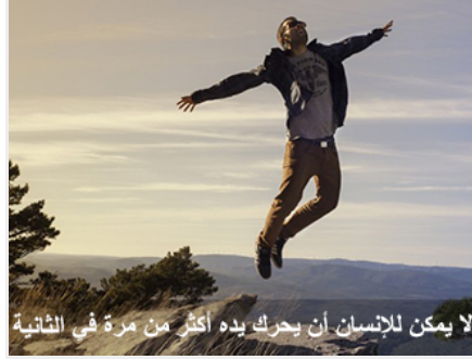
لا يمكن للإنسان أن يحرك يده أكثر من مرة في الثانية

يستطيع بتغيير زاوية جناحيه أن يتقدم للأعلى والأسفل، والأمام والخلف، رفرقة الطنان بجناحيه وعدم تضارره منها أبداً محيراً جداً، لا يستطيع أي إنسان أن يحرك ساعديه في الثانية إلا مرة واحدة على الأكثر