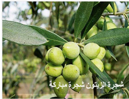
شجرة الزيتون شجرة مباركة

أيها الأخوة الكرام ؛ في أحاديث كثيرة صحيحة عن رسول الله صلى الله عليه وسلم سُمي شجرة الزيتون بالشجرة المباركة،