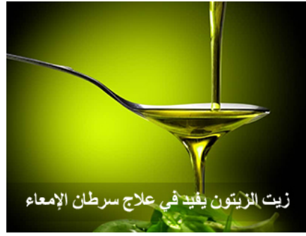
زيت الزيتون يفيد في علاج سرطان الأمعاء

الذي يذهب ضحيته ما يقدر بعشرين ألف شخص سنوياً في بريطانيا وحدها، وفي العالم رقم فلكي لمرضى ورم الأمعاء الخبيثة،