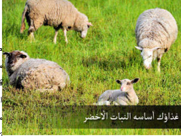
غذاؤك أساسه النبات الأخضر

قرأت مرة كلمة يقول كاتبها : إن أعقد معمل صنعه الإنسان من دون استثناء لا يرقى إلى مستوى الورقة، ماذا يتم في هذه الورقة؟ كما قلت قبل قليل: النبات يمتص الماء مع المعادن المنحلة فيه من التربة، والورقة تأخذ الأزوت من الجو، والشمس لها دور كبير جداً في تصنيع نواتج هذه الورقة، الورقة تصنع ما