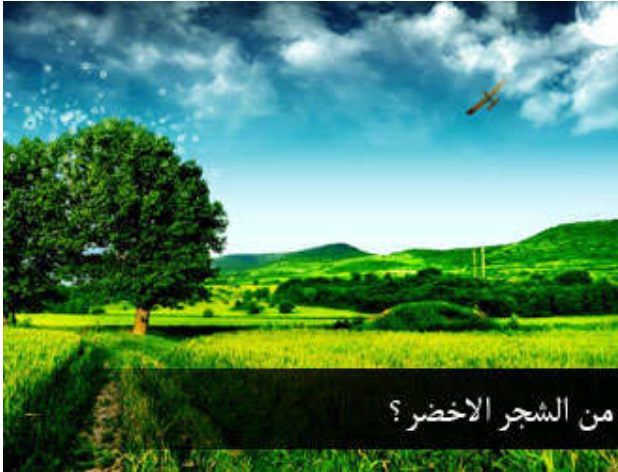
من الشجر الاخضر؟

يسميه علماء النبات النسغ النازل، نسغ صاعد ونازل، صاعد فيه ماء وأملاح المعادن، ونازل هذا النازل، تصور سائلاً يمكن أن يكون قماشاً، أو خشباً، أو حديداً، أو بساطاً، النسغ النازل؛ سائل واحد يصنع ثمرةً، ويصنع ورقة، ويصنع غصناً، ويصنع جذعاً، ويصنع جذراً، والسائل واحد، فهذا النسغ النازل هو سبب ظهور الثمار والأزهار في الربيع، وسبب نمو الأغصان، وسبب ازدياد قطر الجذع، وسبب نمو الجذور، كله من مادة أصلية واحدة.