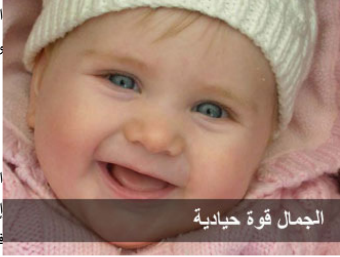
الجمال قوة حيادية

الجمال قوة ، يمكن أن يستخدم في إغواء الآخرين ، أو في ابتزاز أموالهم، فالمرأة الجميلة إذا كانت زوجة صالحة قامت على بيتها ، وعلى رعاية زوجها