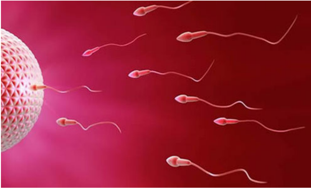
حركة الذيل تساعد النطفة على الحركة باتجاه البويضة

مقدمة النطفة فيها درع ودرع ومنصة ، ثم محرك ، هذا الذي يدور ، ثم ذيل لتنفيذ الحركة . تصميم الدرع الموجود في الجهة الأمامية للنطفة سيحمل هذا الحمل الثمين طوال هذه المسافة الطويلة من جميع أنواع الأخطار ، وتصميم النطفة غير محصور بهذا فحسب ، فهناك في القسم الأوسط للنطفة محرك قوي جداً ، ويرتبط بطرف هذا المحرك ذيل النطفة القوة التي ينتجها المحرك تدور الذيل كالمروحة ، وتؤمن للنطفة قطع الطريق بسرعة ، ولوجود هذا المحرك لا بد من وقود لتشغيله ، وقد حسبت هذه الحاجة أيضاً فركّب له وقود أكثر اقتصاداً ، وأكثر فعالية ، وهو سكر الفلكتوز على السائل ، وهذه النطف مأخوذة بمنظار حقيقي تمشي باتجاه البويضة .