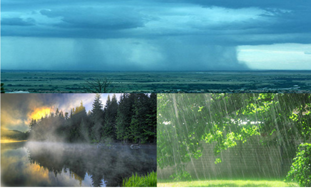
السمااء تبخر الماء لترجعه مطراً

فُهمت في وقت ما على أن السمااء ترجع بخار الماء مطراً ، السمااء ترجع هذا البخار مطراً ، شيء رائع جداً يعني تفسير علمي لهذه الآية .