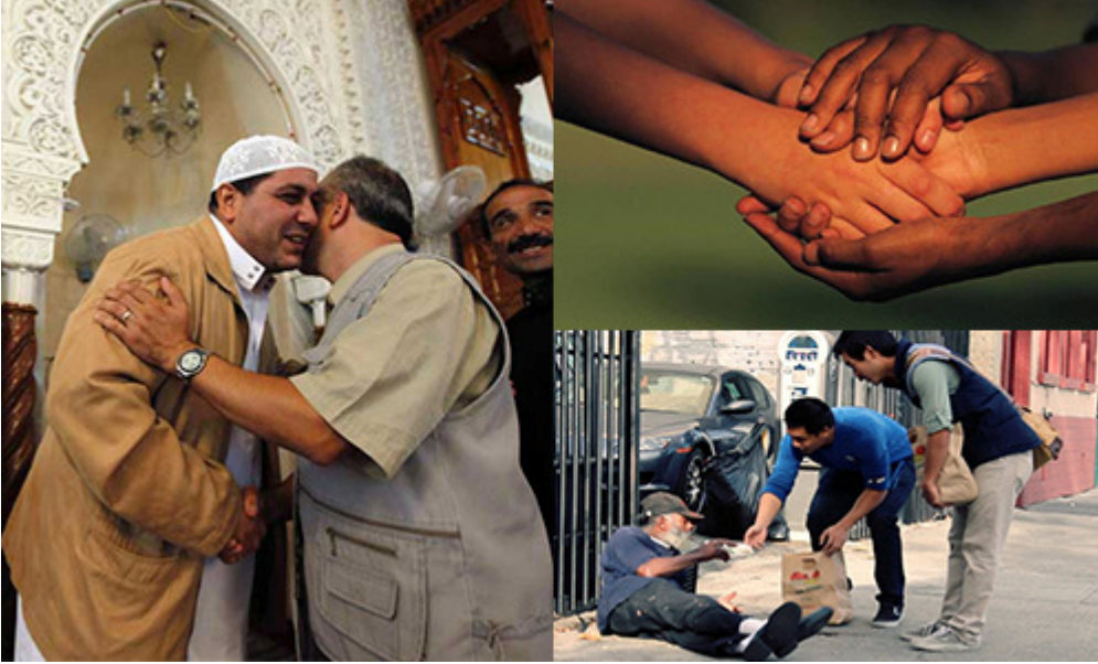
التعاون والحب والتواضع من صفات المؤمنين الحق

لذلك مرة كان سيدنا عمر وزير العدل في عهد الصديق ، يبدو أن هناك قضية أحالها إليه ، فسيدنا عمر ارتأى أن يرفض طلب هذا المستدعي ، فذهب هذا الإنسان لسيدنا الصديق ليوقع بينهما ، قال للصديق الخليفة أنت أم هو ؟ فقال هو إذا شاء ، لا يوجد مشكلة ، نحن بحاجة إلى هذا الحب وهذا التعاون ، فلذلك سيدنا عمر حينما وقف هذا الموقف دعمه الصديق .