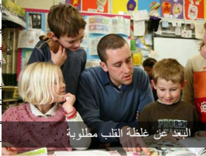
البعد عن غلظة القلب مطلوبة

أيها الأخوة الكرام ؛ بقي شيء واحد وأخير طبعاً أشير إلي بقي خمس دقائق مضى ثلاث ونصف على ما أعتقد ، آخر شيء هناك اختلاف طبيعي ، يعني غداً واحد رمضان ، اليوم ٢٩ شعبان سمعنا صوت مدفع ، عندكم مدفع للإثبات ؟ ما في عندكم مدفع ، معنا بالشام في مدفع سمعنا صوت مدفع ، يا ترى مدفع رمضان ولا تفجير