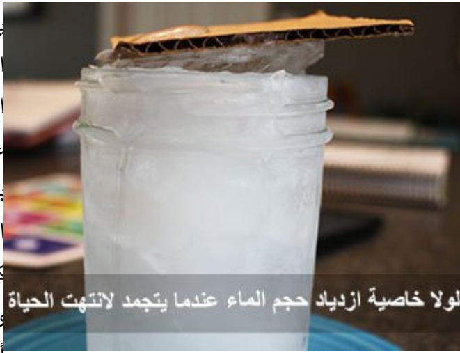
لولا خاصية ازدياد حجم الماء عندما يتجمد لانتهت الحياة

يتفكرون فعل مضارع ، والمضارع يعني الاستمرار ، أنت أمام كأس ماء ، و هذا الماء له خاصية ينفرد بها عن أي عنصر في الأرض ، أنك إذا بردته بدرجة زائد أربع يزداد حجمه ، ولولا هذه الخاصية لما كان هذا المجلس ، ولما كانت عمان أصلاً ، ولما كان الأردن ، ولولا الشرق الأوسط، ولا كان هناك حياة أساساً ، لو أن الماء إذا تجمد انكمش