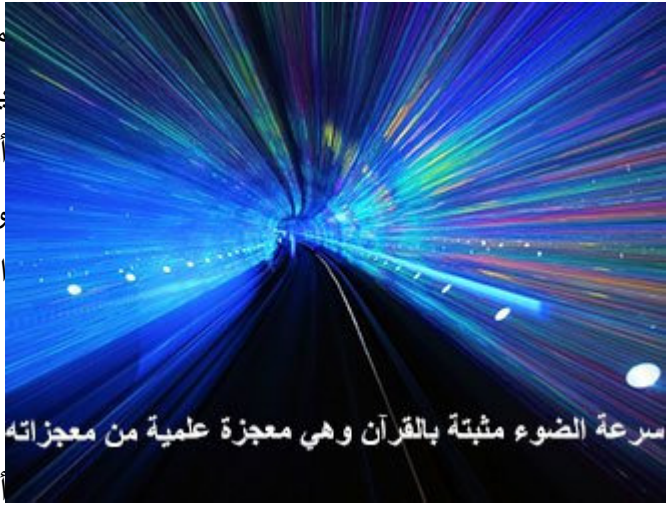
سرعة الضوء مثبتة بالقرآن وهي معجزة علمية من معجزاته

الشمس ، هذه الدورة شكلها بيضوي ، المسار بيضوي أو إهليلجي ، الأرض في دورتها حول الشمس المسار إهليلجي ، الآن الأرض بالقطر الأطول ، ما معنى إهليلجي ؟ أي بيضوي ، له قطران قطر أطول وقطر أصغر ، تدور دورة كل عام ، الآن الأرض هنا بالقطر الأطول تتجه إلى القطر الأصغر ، المسافة قلت ، و الجاذبية ازدادت ، هناك احتمال أن تتجذب الأرض إلى الشمس ، إحتمال يقيني ، فإذا انجذبت إلى الشمس قد لا تصدقون تبخرت في ثانية واحدة ، الأرض كلها ، الأرض تدور حول الشمس دورة كل سنة ، فإذا اقتربت الأرض من القطر الأصغر الجاذبية ازدادت ، فإذا ازدادت الجاذبية - الجاذبية معلقة بالكتلة والمسافة - المسافة قلت ، انجذبت الأرض إلى