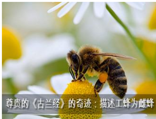
尊贵的《古兰经》的奇迹：描述工蜂为雌蜂

飞行的蜜蜂，探花的蜜蜂，跳舞的蜜蜂，蜂王，蜂王的服务员，蜂王浆，雄峰。蜂王生雌蜂、雄峰、蜂王，要知道现在出来的这个是蜂王，就把他放在蜂王的领域，第二个是雄峰，就让它和雄峰在一起，它怎么知道？通