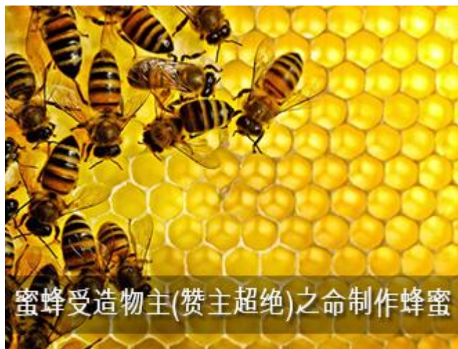
蜜蜂受造物主(赞主超绝)之命制作蜂蜜

现在，最先进的运输工具，在行驶期间制造东西，有些在澳大利亚的大公司装上原料，在路上用这些原料制造铝合金卖到塞浦路斯，轮船工厂。蜜蜂的世界有令人难以置信的事情，当蜜蜂吸了花蜜，它留下痕迹，说明这