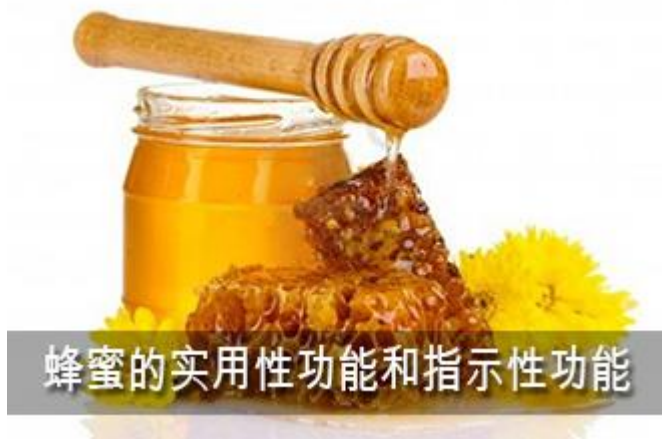
蜂蜜的实用性功能和指示性功能

指示性功能，穆斯林占优势。最好是汇聚它俩，蜂蜜的功效确是给人治病的，至于蜂蜜的指示性作用，你从它上认识安拉，这是多么紧密