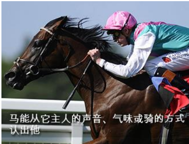
马能从它主人的声音、气味或骑的方式认出他

马的伤痊愈地最快，比人类快好多，它的伤口痊愈地非常快。马吃的饲料很少，干得却很多。它能驮着相当于自身重量的四分之一的人或物奔跑很长的路程，是奔跑，不是行走，四百公斤的马