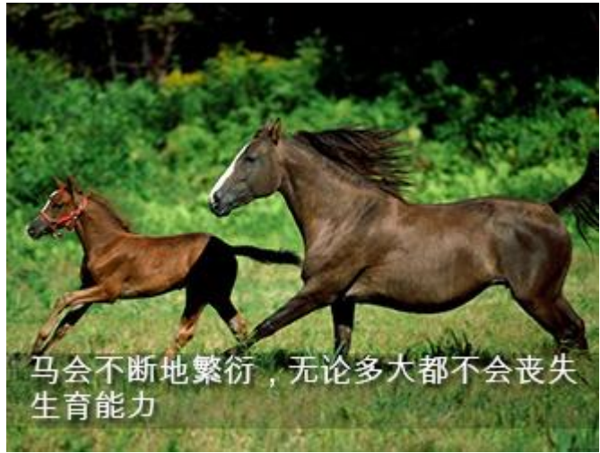
马会不断地繁衍，无论多大都不会丧失生育能力

想象一下：一位八十岁的老太太怀着孕。人四十岁就不行了，绝经了。马不论多大年纪，始终拥有生育能力。你们谁买了辆车，过了一年发现它旁边有一辆小车了？