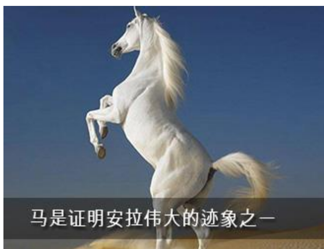
马是证明安拉伟大的迹象之一

另一位兄弟告诉我：“我有匹马，我非常喜爱它，但我把它卖了。有一次突然遇到，它哭了”，马是最忠诚的动物之一。有位在美国的兄弟看的一个关于骑马的电视节目，节目强调了骑马可预防心脏、肝及肾上的疾病，而长期乘车会导致心脏、肝和肾上的疾病，震动会影响听力。安塔拉·阿巴斯有匹马，他的诗中有他曾在枪林弹雨的战场的记载：