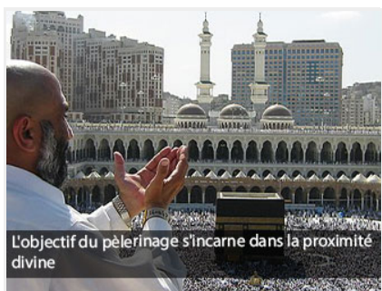
Le choix de l'emplacement de La Maison d'Allah Exalté Soit-Il

dans une région sèche au climat aride et saharien, s'avère d'une sagesse éminente. S'ajoute à cela l'interdiction au pèlerin de se vêtir en habits cousus, de se parfumer, de se raser ou de se couper les cheveux, en un mot de jouir des grâces licites qui lui sont accordés hors du pèlerinage, afin de consolider sa communication d'avec Allah Exalté Soit-Il, afin de vivre cette paix mêlée d'extase qu'il ressent de Sa Proximité Divine, loin de tout effet et de toute influence matérielles qui le leurrent d'un plaisir concret mais éphémère ! Et ce, afin que le pèlerin réalise que lorsqu'il accède à Allah Exalté Soit-Il, tout l'univers terrestre se révèle inapte à l'envelopper de cette béatitude à la fois permanente et contradictoire. On le voit invoquer Son Créateur impulsivement : O, Allah, que perd celui qui Te trouve ? Et que gagne celui qui s'égaré loin de toi ? !