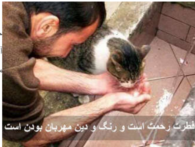
فطرت رحمت است و رنگ و دین مهربان بودن است

«پس روی خود را خالصانه متوجه آئین ( حقیقی خدا، اسلام ) کن. این سرشته‌ی است که خداوند