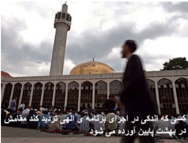
کسی که اندکی در اجرای برنامه ی الهی تردید کند مقامش در بهشت پایین آورده می شود

باری دوستم به من می گفت: ساعت چهار صبح درب خانه ی مرا زدند. درب را گشودم کسی را ندیدم. وقتی به پایین نگاه کردم کیسه ای را دیدم که می جنبد. جنینی را دیدم که تازه زاده شده بود. آن را دم درب خانه ی ما گذاشته بودند. زنگ را زده و گریخته بود. من اندیشیدم. یک انسان ازدواج می کند. در حقیقت این عقد ازدواج نیست. پس از آن نوشته می شود. و عروسی گرفته می شود و بعد از آن خبر شادمانی در همه جا پخش می شود. زن خدا را شکر حمله است. اکنون برای نوزاد آماده می شوند. تخت ویژه و لباس های ویژه و عطرهای ویژه و ماه های طولانی برای این مهمان جدید آماده می شوند. جنین زاده می شود. تماس ها گرفته می شود و تبریکات و هدیه ها و گل ها ... این ازدواج شرعی است. اما اگر نوزاد حاصل زنا باشد در کیسه ای گذاشته می شود و جلوی درب گذاشته می شود. صاحب نوزاد درب را می زند و می گریزد.