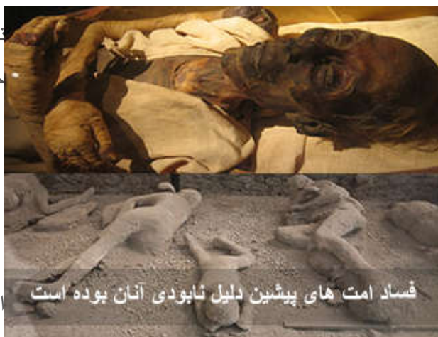
فساد امت های پیشین دلیل نابودی آنان بوده است

(( كانوا إذا سرق فيهم الشريف تركوه ، وإذا سرق فيهم الضعيف أقاموا عليه الحد ))